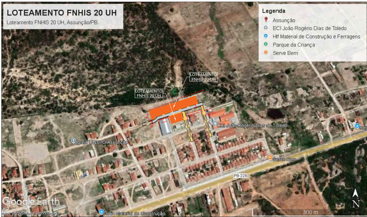
3 Mapa de localização do empreendimento