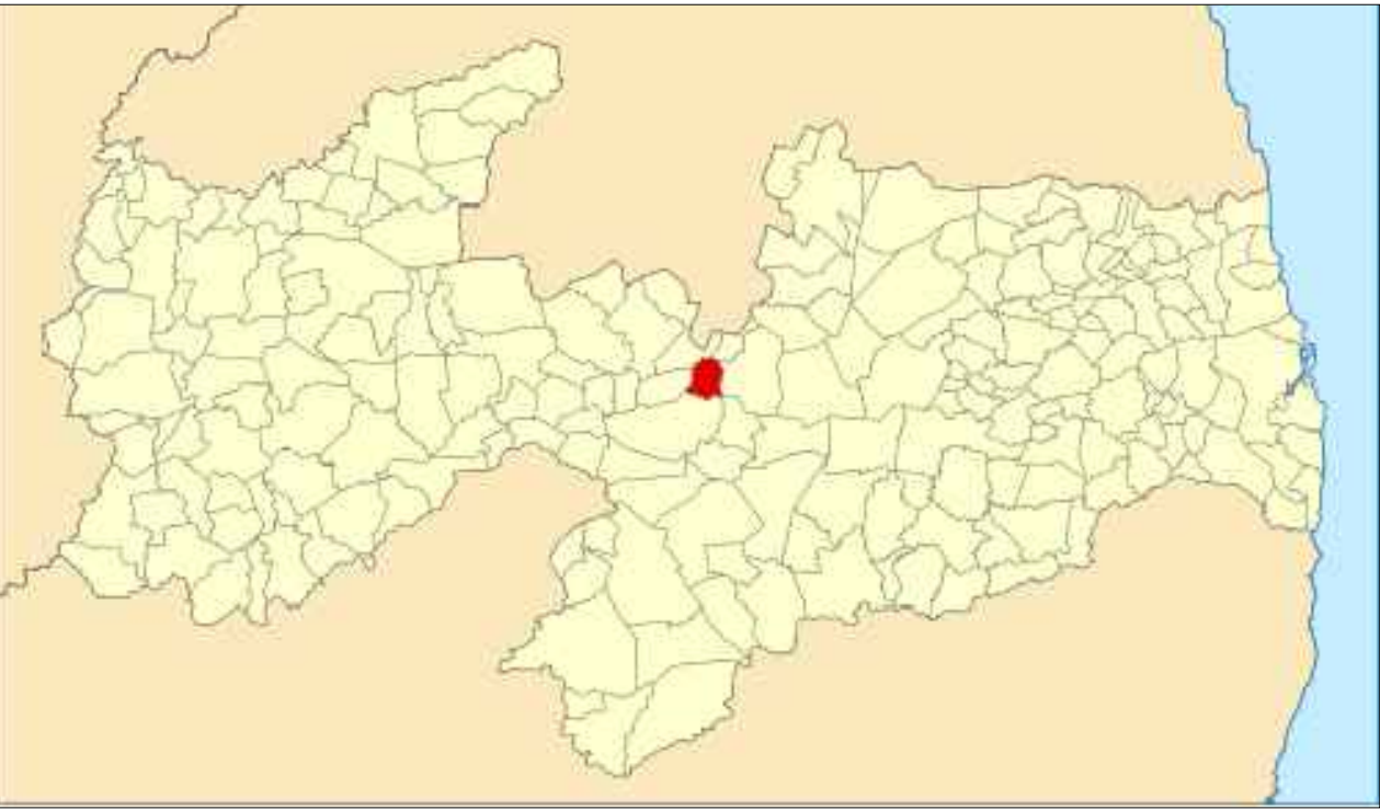
2 Mapa de localização de Assunção